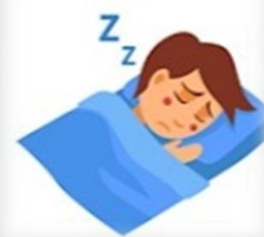
Общая слабость и озноб

Инкубационный период может длиться от нескольких часов до 7 суток.