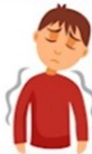
Ломота в теле