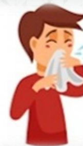
Заложенность носа, Чиханье