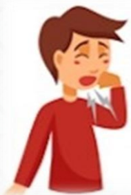
Першение в горле, Кашель